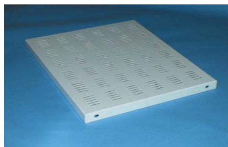
PIANO INTERNO CONSOLLE CLE

Realizzato in lamiera verniciata viene fornito in confezione singola con relativa viteria per il fissaggio