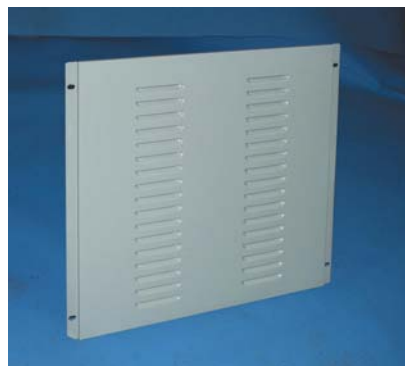
PANNELLO ANTERIORE AERATO PER CLE

Realizzato in lamiera con alette di aerazione